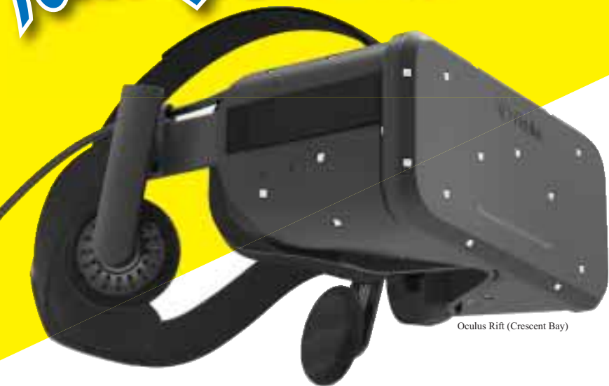
Oculus Rift (Crescent Bay)